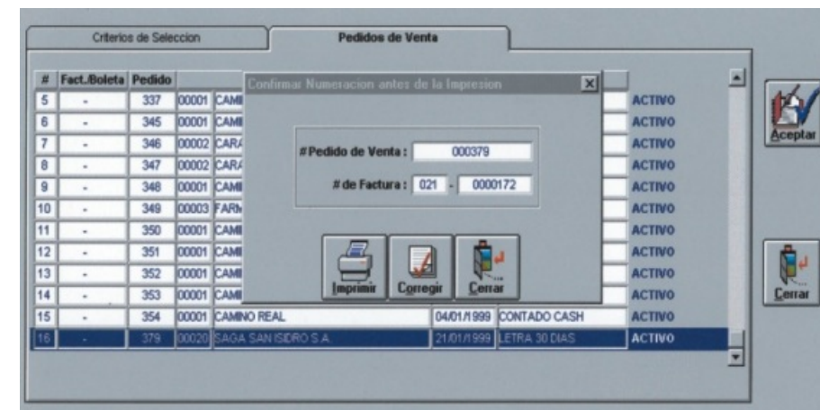
Módulo de Facturación

Así no se pierde la venta y se logra una mayor efectividad en el despacho y atención al cliente.